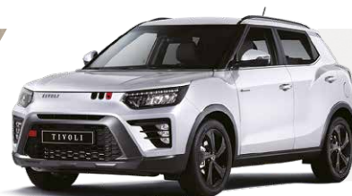
Alb GRAND (WAA)