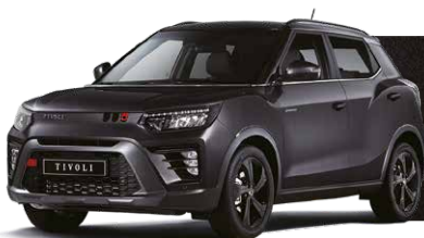
Negru SPACE (metalizat) (LAK)