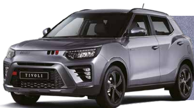
IRON metal (metalic) Argintiu (metalizat) (ADE)