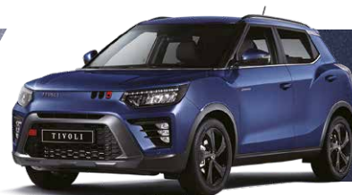
Albastru DANDY (metalizat) (BAS)