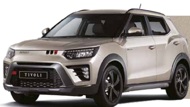
LATTE greige (metalic) (EBL)