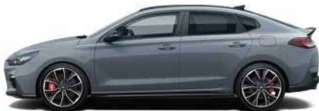
Gri Shadow Solid (TKG)