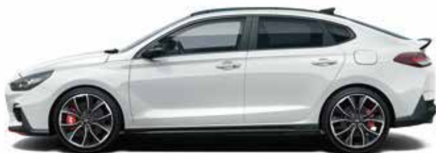
Alb Polar Solid (PYW)