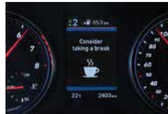
Sistem de avertizare a conducătorului auto (DAW)