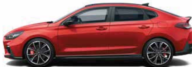
Rosu Engine Solid (JHR)