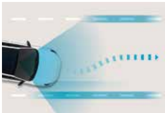
Sistem de asistență la menținerea benzii de rulare (LKA)