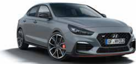
i30 Fastback N pachet „Performance” (275 CP)