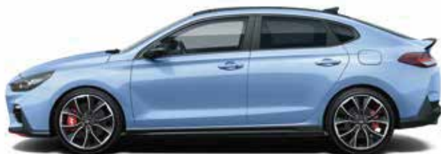
Albastru Performance Solid (XFB)