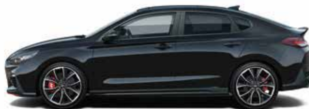
Negru Phantom Perlat (PAE)