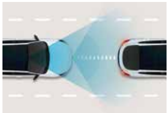
Sistem de asistență la coliziune frontală (FCA)