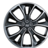
Jante din aliaj de 19”