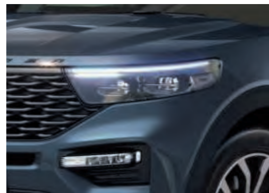
Faruri cu leduri cu tratament fumuriu sport.