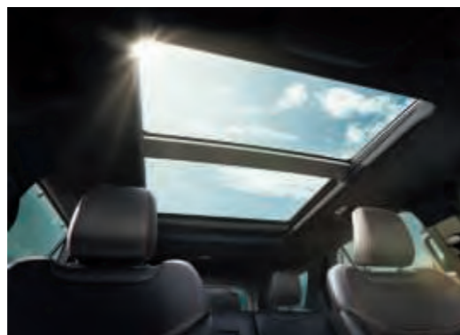
Trapă panoramică cu panouri duble și acționare electrică.