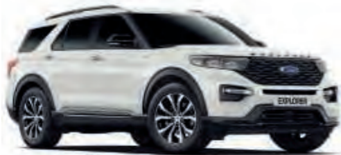
Oxford White †