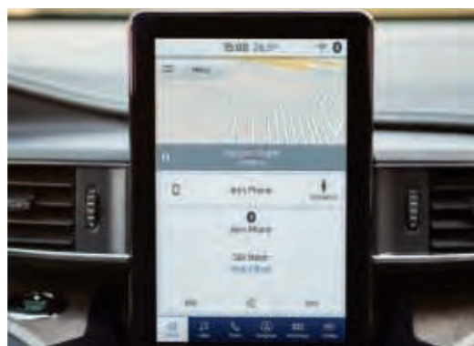
Ecran tactil LCD TFT de 10,1", stil portret.