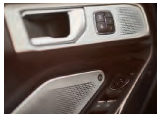
Sistem audio B&O cu 14 difuzoare și subwoofer.