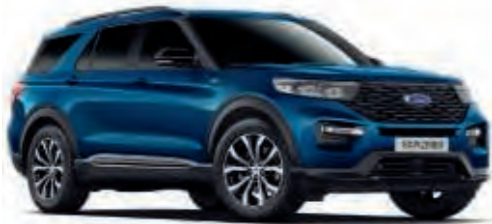
Atlas Blue †

Vopsea metalizată cu strat exterior transparent*