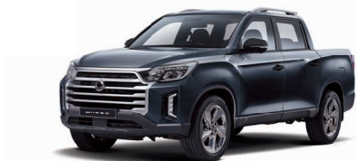
GALAXIES grey metalizat (ADB)