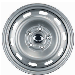
Jantă Oțel 17" Cu Anvelope 235B84:B109/70 R17 XI