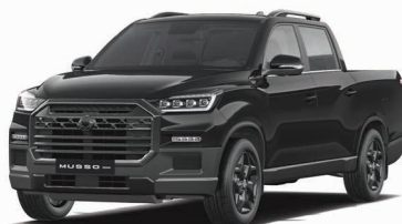
SPACE black metalizat (LAK)