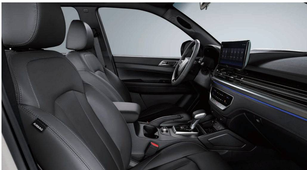
Textil negru, plafon negru (LBT1)