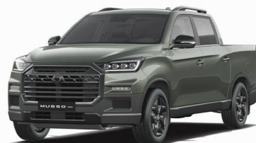
AMAZONIA green metalizat (GAM)