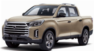
SAND beige metalizat (EBK)