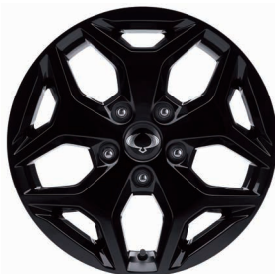
Jantă Aliaj În Culoare Negru 18" Cu Anvelope 255/60 R18