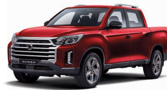
INDIAN red metalizat (RAJ)