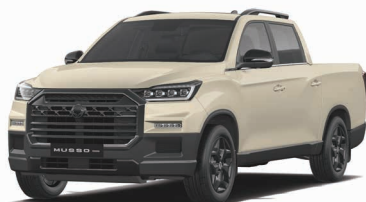
SAND beige metalizat (EBK)