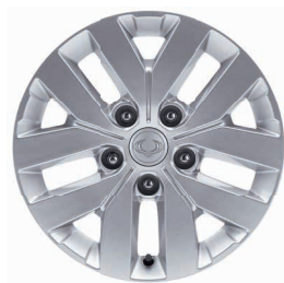
Jantă Aliaj 17" Cu Anvelope 235/70 R17 XI