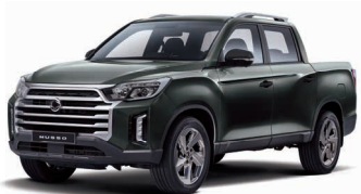
AMAZONIA green metalizat (GAM)