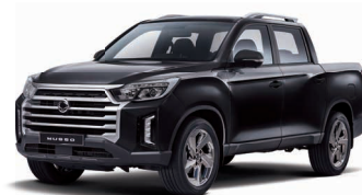
SPACE black metalizat (LAK)