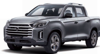
MARBLE grey metalizat (ACM)