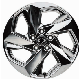
Jantă Aliaj Cromată De Cu Anvelope 20" 255/50 R20 Tyres