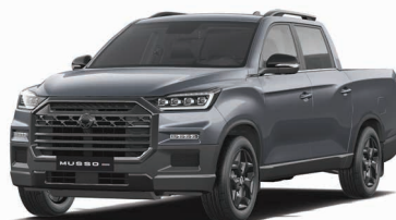
MARBLE grey metalizat (ACM)