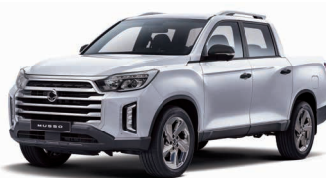
SILKY WHITE (Pearl) (WAK)